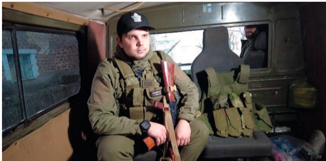
«Тосик» передаёт большой привет Югре и югорчанам, а также маме и бабушке, всем родным и друзьям

Не зря АГС-17 называют «карманной артиллерией пехоты»: это почти артиллерийский калибр, высокая кучность попаданий, довольно