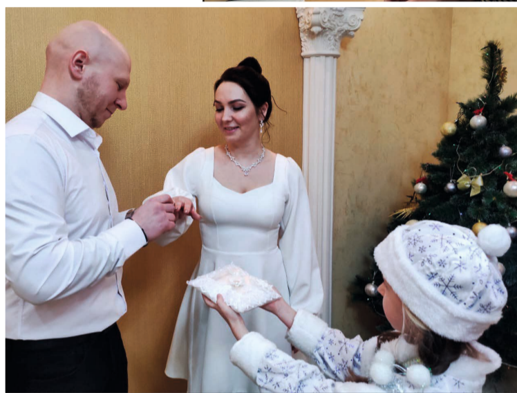
Приятным сюрпризом для молодожёнов, заключивших брак под самый Новый год, стало участие в торжественной церемонии Снегурочки

Все семьи новорождённых получили от округа подарок «Расту в Югре» — шкатулку ручной работы с символикой региона. Есть в этом памятном подарке и финансовый бонус — мультикарта номиналом 20 тысяч рублей. Напомним: такая мера региональной поддержки действует в Ханты-Мансийском автономном округе — Югре с 1 января 2020 года.