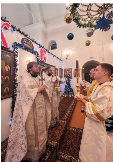
Во всех храмах Советского района в честь Рождества Христова прошли праздничные богослужения и молебны

Отмечать Рождество Христова в России начали в X веке после принятия христианства, оно напоминает об идеалах добра и милосердия, о вере в чудеса, наполняет взрослых и детей радостью и ожиданием волшебства, обращает к духовным традициям. Нет другого дня, который отличился бы таким богатством