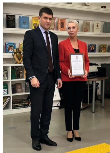
В ходе конференции состоялось награждение тех, кто внёс значительный вклад в подготовку и проведение сентябрьских выборов

Подробный и информативный отчёт секретаря местного отделения «Единой России» был единогласно принят участниками конференции, после чего с докладом о проделанной работе выступила руково-