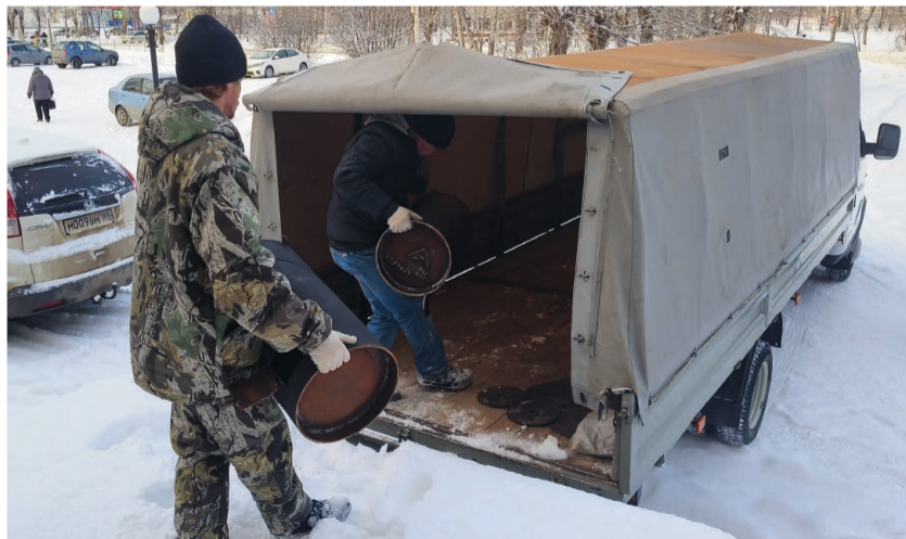
На передовой очень нужны печи, медикаменты, бензопилы для заготовки дров, генераторы для подачи света и тепловые пушки

Состав груза весьма многообразен, есть буквально всё, что необходимо нашим ребятам на передовой в сегодняшних условиях, — от бытовых вещей, — от бытовой одежды и медикаментов до электроинструментов, хозяйственного и даже промышленного оборудования. В формировании очередной партии гуманитарного груза приняли самое активное участие все поселения Советского района, что стало уже доброй традицией. Однако один из посёлков на этот раз был отмечен особо. «Большой вклад внесли жители Коммунистического. Там есть и адресные посылки, и посылки для всего подразделения, которому мы направляем груз», — пояснил помощник главы Советского района Евгений Сабанцев.