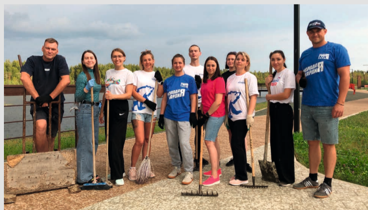
Молодогвардейцы «Единой России» г.п. Советский на субботнике

днём молодёжью и пожелать им счастья, здоровья и патриотических чувств».