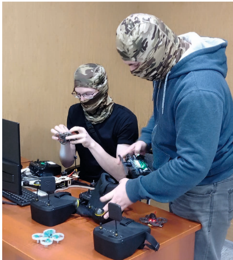
Мастера-умельцы «Сармата» подготовили для отправки на передовую 15 беспилотников