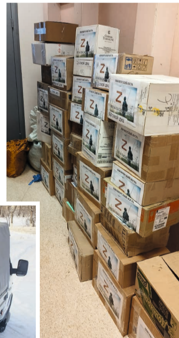
Около 5 тонн груза отправлено нашим бойцам

стоянно вносят весомый вклад в обеспечение нормальных бытовых условий и безопасности наших военнослужащих, выполняющих боевые задачи. «Студенты колледжа своими