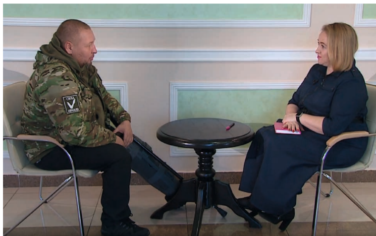
Боец говорит, что неодолимого страха не испытывал даже во время боевых действий

относились как к старшему, — говорит он. — И звание у нас там быстро растёт. Многие, что называется, заснули рядовыми, а проснулись командирами, лейтенантами. Так же и я — был старшим стрелком-сапёром, а стал старшиной управления связи. А старшина для солдат — как второй отец. Кого-то нужно по голове погладить, кого-то — по каске стукнуть — например, в ситуации, когда видишь, что человек после первого боя излишне растерялся. Вообще, в военной обстановке очень выражает чувство юмора. Мы по-