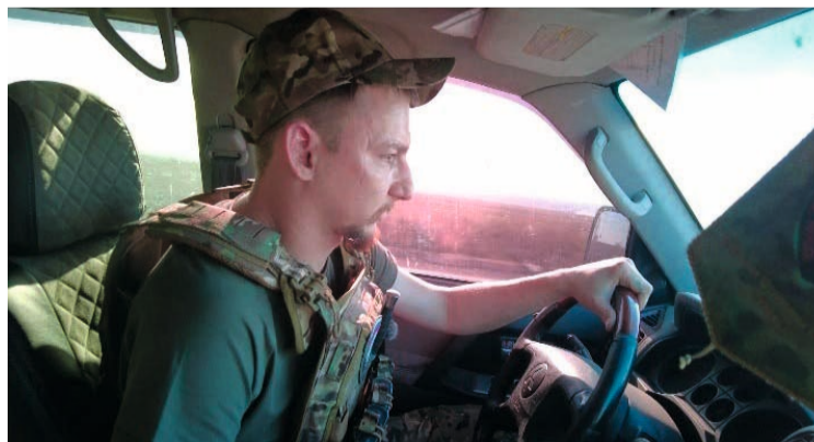
Хоть не на переднем крае находится, но пользу свою для фронта ощущает

Но весной 2023 года нашлась и для него работа — в пункте временной дислокации, кото-