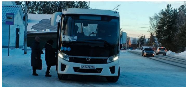
В настоящее время разрабатывается специальная платформа для общего доступа, которая позволит увидеть, где находится автобус и когда подойдёт к остановке

щее время Департаментом дорожного хозяйства совместно с Департаментом информационных технологий и цифрового развития округа разрабатывается специальная платформа для общего доступа, чтобы жители смогли увидеть, где находится автобус и когда подойдёт к остановке, там же будет доступна информация по всем маршрутам, открытым на территории автономного округа.