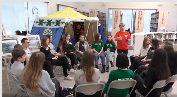
Во время мероприятия участники погрузились в разнообразие национальных культур

Мероприятие прошло в два этапа, первый из которых — образовательный: ребята узнали много нового о России как о стране возможностей, а также познакомились с проектами, разработанными «Движением первых», которые ещё ждут своей реализации. А самым яркой частью стала интернациональная игра, в ходе которой школьники поделились на команды-«семьи», и каждый участник методом погружения изучал культуру и традиции русских, татар, бу-