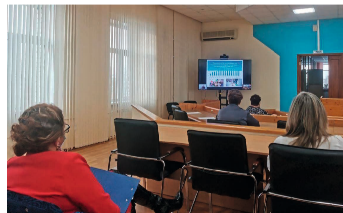
Совещание состоялось в режиме ВКС накануне Всероссийского дня инвалидов