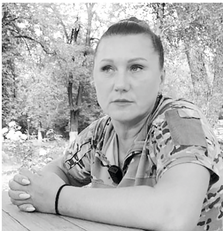
Реабилитационный центр мамы Лены — ещё и место сбора гуманитарной помощи нашим бойцам, сюда привозят и гуманитарку из Югры, а потом отправляют по подразделениям

В 2022 году в реабилитационный центр поехали и солдаты Российской армии. Очередь, бывает, растягивается до трёх месяцев.