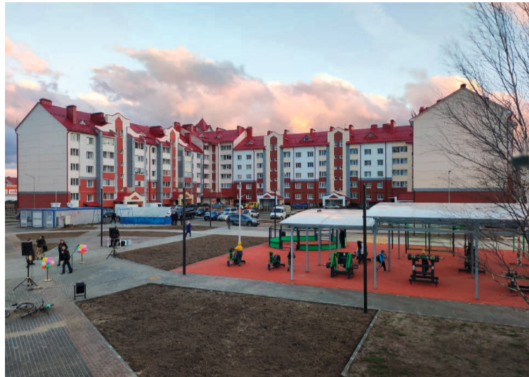
В Белоярском открыли многофункциональную дворовую площадку

В Нефтеюганске уже этой зимой жители смогут воспользоваться услугами новой лыжной базы. На базе выполнено асфальтирование, произведена засыпка песка, установлены совре-