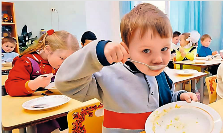
Изменения затронули окружной закон о компенсации части родительской платы за детские сады

Решение о дополнительных мерах по социальному обеспечению членов семей граждан, поступивших в добровольческие формирования для участия в специальной военной операции, приняла Дума Югры. Изменения затронули окружной закон о компенсации части родительской платы за детские сады. В связи с этим родителям или законным представителям детей, которые приходятся родственниками участникам добровольных