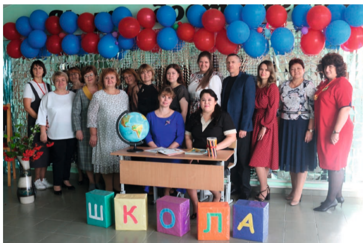
Коллектив Зеленоборской школы

Школа живёт, радуется победам и строит планы на будущее. «Желаем всем учителям, ветеранам педагогического труда, выпускникам, родителям, специалистам школы неиссякаемой энергии, оптимизма, упорства в достижении целей, веры и уверенности в завтрашнем дне! Зеленоборской школе желаем процветания, коллективу — успешного творчества, а ученикам — блестящих перспектив!», — такие слова звучат от каждого, кто знаком с этим образовательным учреждением.