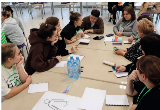
Мотивационная сессия в «Окунёвских зорях» была разделена на несколько стадий

Мотивационная сессия в «Окунёвских зорях» была разделена на несколько стадий, среди которых — спортивный квест на свежем воздухе, предполагающий коллективное преодоление несложных препятствий, методическое мероприятие на закрепление теоретических знаний, психологические тренинги, направленные на повышение уровня самообладания и самоконтроля, а также йога-терапия. Каждый педагог мог направить своё внимание именно на то, что ему особенно важно и необходимо, а наставник — поделиться своим опытом. В конечном же итоге всё мероприятие было нацелено на оптимизацию работы с детьми в образовательных организациях муниципалитета.