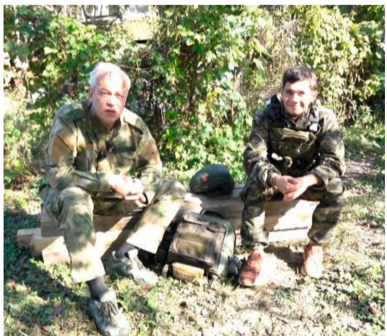
Наша цель — закончить это всё и с победой вернуться домой

вместе со всей нашей армией выполнят свою главную задачу.