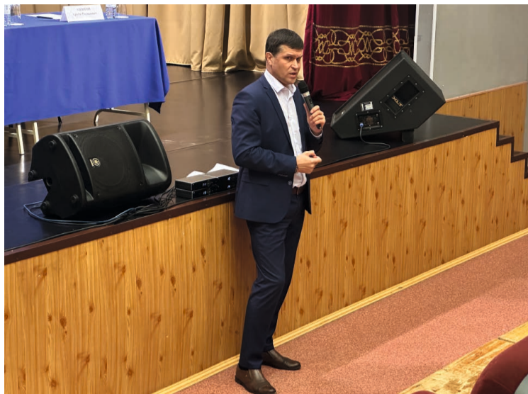
Глава рассказал присутствующим о льготах и мерах поддержки, положенных военнослужащим и членам их семей, а также предостерег от телефонных мошенников

Следующая встреча состоялась в Малиновском. Основная