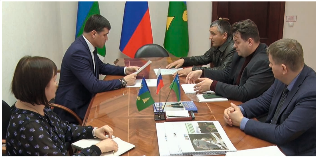
Работу геофизической компании курирует Федеральное агентство по недропользованию, однако муниципалитет также готов оказать специалистам необходимую помощь