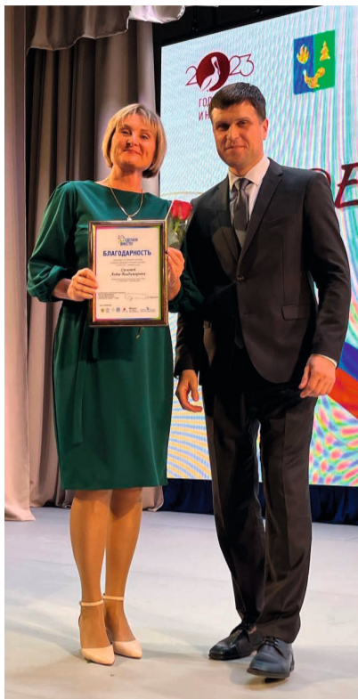
За многолетний добросовестный труд лучшие педагоги были отмечены наградами

В Советском районе уже стало доброй традицией в профессиональный праздник обновлять Доску почёта Управления образования. В этом году её будут украшать портреты 24 учителей, и это не только преподаватели общеобразовательных дисциплин, но и педа-