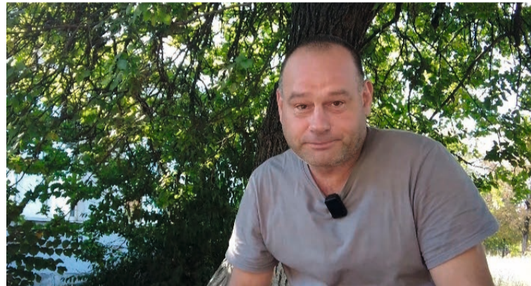
«Вахта»: «Если Родина воюет, то ей надо помогать»

Ханты-Мансийский автономный округ сегодня — лидер в России по финансовой поддержке тех, кто решил заключить контракт на воинскую службу.