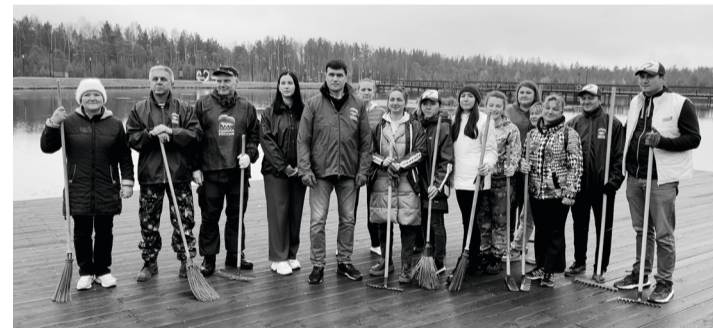
Вот такой дружной командой вышли представители «Единой России» на субботник