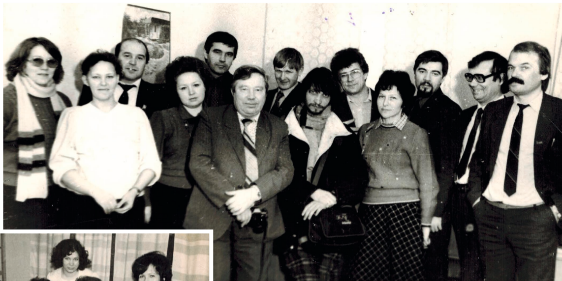
На межрайонной летучке журналистов «Пути Октября» с коллегами из Урайской городской газеты «Знамя», конец 80-х годов