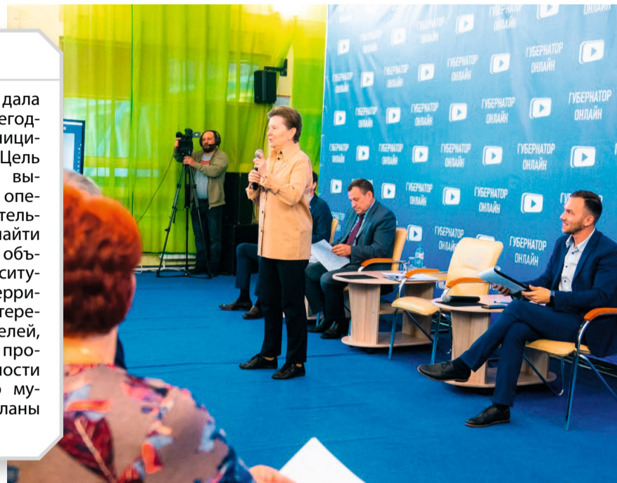
Глава региона встречается с югорчанами для получения обратной связи, сбора их мнений