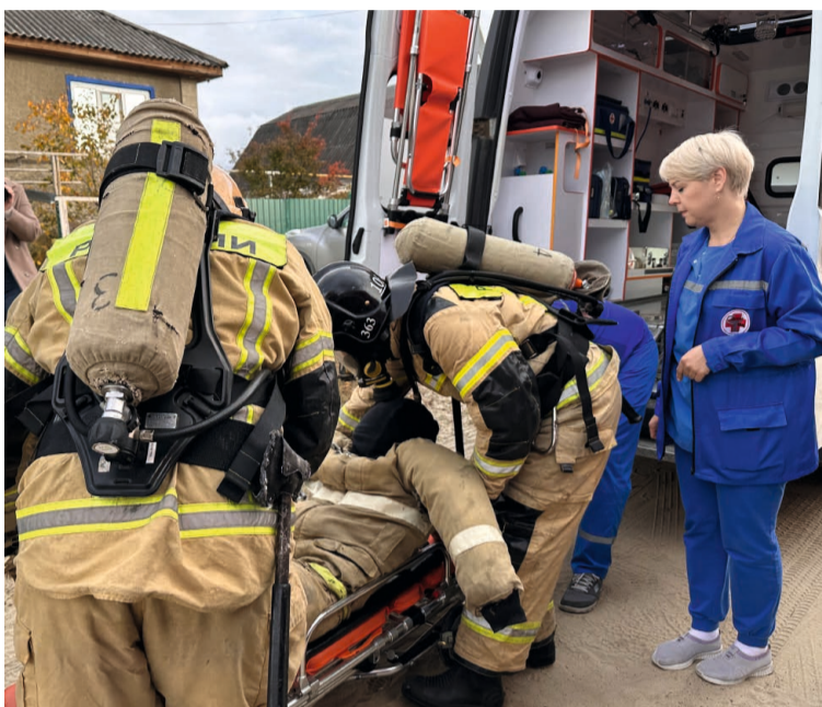
Спасатели передали макет пострадавшего, извлечённый из-под завалов, в руки медиков

На базе спорткомплекса «Дорожник» для условных пострадавших и эвакуированных жителей, ожидавших отправки в «Окунёвские зори», был экстренно организован пункт временного размещения. Чтобы в него попасть, необходимо было пройти регистрацию и небольшой медицинский осмотр, в ходе которого гражданам измерили температуру и артериальное