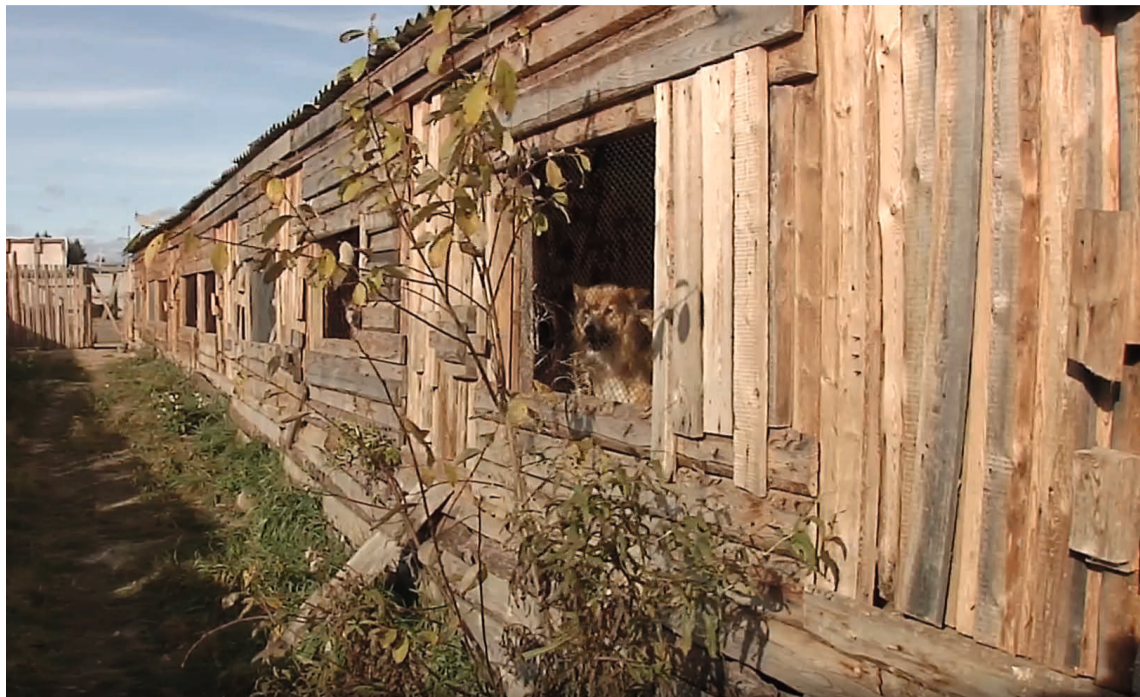
С начала 2023 года в районном центре было отловлено 166 бродячих собак

ния, то есть обратно на улицы города, в настоящее время прекращена. «Уже заметно, что популяция животных уменьшается, — говорит Светлана Соколова. — Но пока граждане не перестанут выбрасывать недоевших питомцев и выпускать собак на самовыгул, проблема не решится. Во время объездов мы видим большое количество собак в ошейниках, что означает, что владельцы у них есть. Обращаюсь к жителям с просьбой: не выпускайте своих собак без присмотра. Напомню, что выгуливать их положено на поводке и в наморднике».