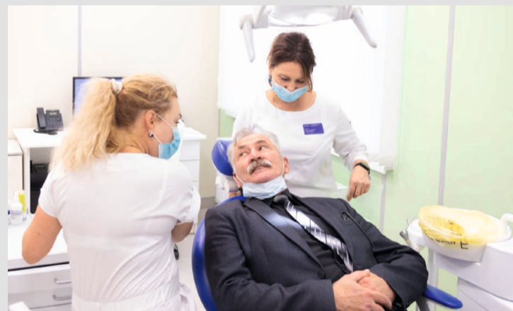
После капитального ремонта в Барсово открылась поликлиника

В Ханты-Мансийском районе построят два новых культурных центра благодаря Карте развития Югры. В Горноправдинске возведут новое здание площадью почти 3,2 тыс. кв. м. В нём намечено разместить Дом культуры на 300 мест, библиотеку на 163 посетителя с книжным фондом 40 тысяч экземпляров, детскую музыкальную школу на 100 воспитанников. Ожидается, что новый Дом культуры примет своих первых посетителей до конца 2024 года. Также продолжается строительство культурно-спортивного комплекса в деревне Ярки. В двухэтажном здании строящегося центра будут расположены зритель-