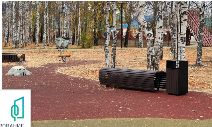
На благоустройство парка в Пионерском в текущем году было направлено 12 млн рублей

Несмотря на недочёты, в целом члены комиссии остались довольны результатом, по общему мнению, парк станет востребованным местом отдыха у местных жителей всех возрастов. «В настоящее время наи-