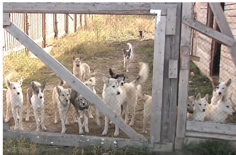
Отловленных собак чипируют, вакцинируют, стерилизуют и оставляют в приюте до тех пор, пока для бродяжки не найдётся заботливый хозяин