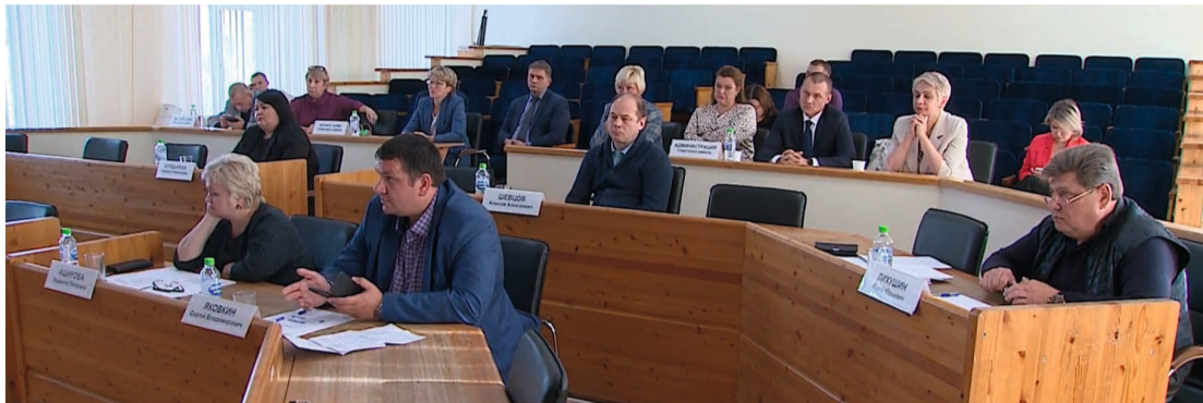
Депутаты предложили рассмотреть вопрос о дальнейшей судьбе спортивного зала в Пионерском с участием представителей всех заинтересованных сторон

Работу районной Думы в новом сезоне открыло совместное заседание всех четырёх постоянных комиссий. Повестка содержала 18 пунктов, по большинству из которых докладчиками были обозначены заместители главы муниципалитета и специалисты администрации Советского района. К которым, как оказалось, за время каникул у депутатов накопилось немало вопросов.