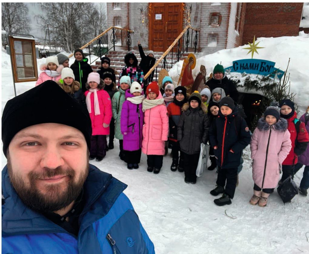
Экскурсия для учащихся школы № 1