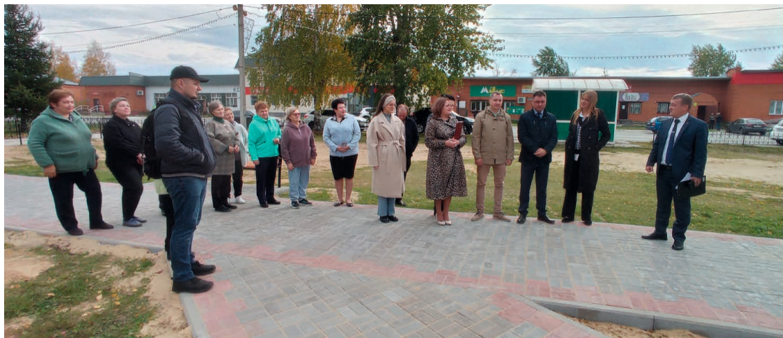
Участники приёмки, осмотрев все участки объекта, дали работе положительную оценку