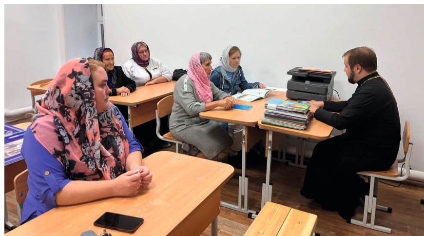
Педагогический совет воскресной школы