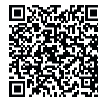
Смотрите сюжет по QR-коду

Важно помнить и о других правилах безопасности: например, отправляясь в лес, не забудьте надеть или взять с собой яркую одежду, расскажите родственникам и друзьям, когда намерены вернуться, и оставьте свои координаты. Это облегчит спасателям задачу в случае, если им придётся организовать поисковые работы.