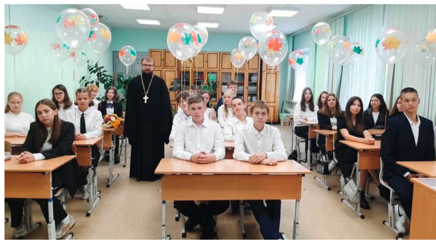
Классный час с учащимися гимназии