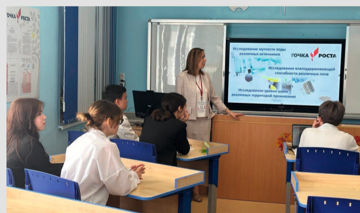
В Октябрьском и Сергино открылись новые «Точки роста»

В Лемпино появится корт. Строительство спортивной площадки идёт полным ходом. Корт станет центром притяжения для любителей активного образа жизни в любое время года. Зимой тут можно будет кататься на коньках, играть в хоккей, а летом — играть в футбол или баскетбол. Новый объект возводят на месте ста-