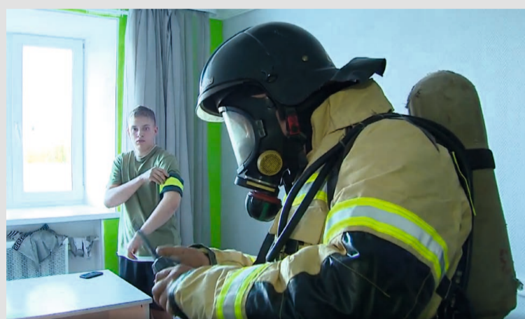
Согласно вводной, в здании остались люди, которых спасатели благополучно эвакуировали

и посетителям срочно покинуть здание!» Это оповещение дало старт пожарно-тактическим учениям. Согласно легенде, в одном из служебных помещений на третьем этаже студенческого общежития Советского политехнического колледжа возник очаг возгорания площадью 30 квадратных метров. Сотрудники об-