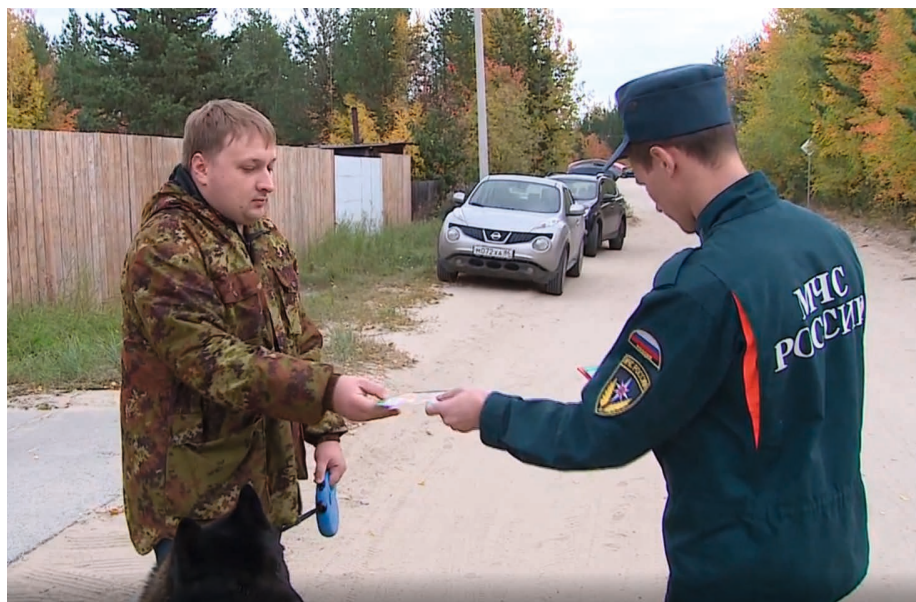
Спасатели проводят беседы и раздают памятки

С наступлением отопительного сезона сотрудники МЧС отмечают рост числа пожаров в жилых домах. В большинстве случаев причиной возгораний является несоблюдение элементарных требований безопасности. Сотрудники МЧС проводят профилактические рейды, чтобы напомнить советчанам правила, следование которым способно уберечь от большой беды.