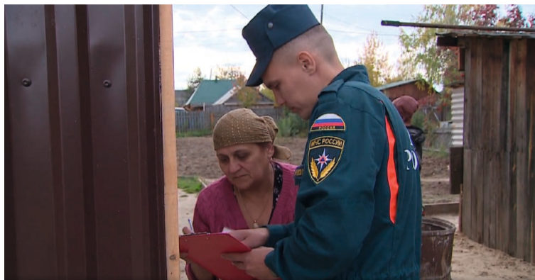
В ходе рейдов горожанам напоминают правила безопасности, чтобы избежать неприятных последствий

Согласно статистике, большая часть возгораний происходит в частном секторе. С наступлением отопительного сезона сотрудники МЧС обращают особое внимание на соблюдение правил эксплуатации