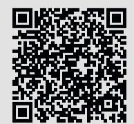
Смотрите сюжет по QR-коду

Подобные учения спасатели проводят регулярно. Их главной задачей является отработка чёткого взаимодействия командного и личного составов всех пожарных частей на случай масштабных чрезвычайных ситуаций. В Советском до конца года огнеборцы планируют провести ещё четыре подобных экзамена на оперативность и профессионализм.