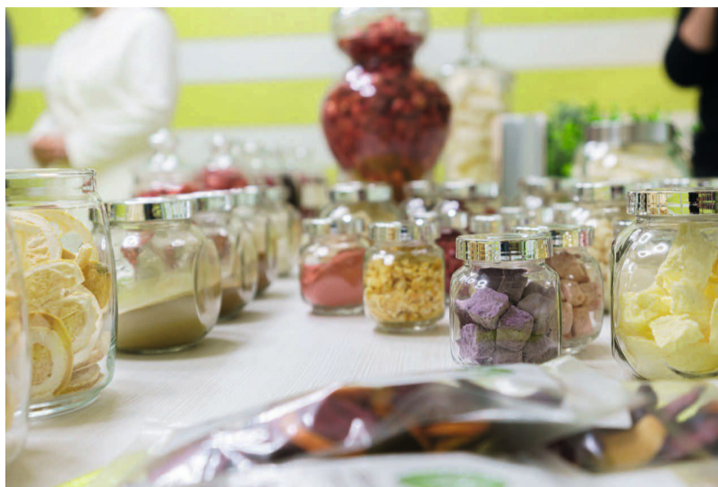
Сублимированные продукты хранятся до нескольких лет без потери вкусовых качеств и витаминов

Тюменские пищевые производства активно сотрудничают с Ханты-Мансийским автономным округом — Югрой. Завод по производству сублимированных продуктов из дикорастущих грибов и ягод начал свою работу в Тюменской области. Производственный комплекс «Грин Лайф» открыт на территории индустриального парка «Боровский».