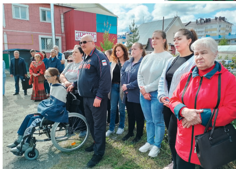
Зал для игры в боччу открывает новые возможности для спортсменов с ограниченными возможностями здоровья

В церемонии открытия нового зала принял участие сенатор Российской Федерации от ХМАО-Югры Эдуард Исаков. «Хочу поблагодарить идейного вдохновителя, человека, который на протяжении многих лет развивает адаптивный спорт в Югре, — Геннадия Терентьева, — отметил гость. — Когда