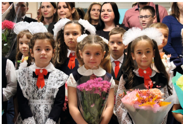
Позади каникулы, а впереди — новые знания, открытия и интересные проекты

Соб. инф.