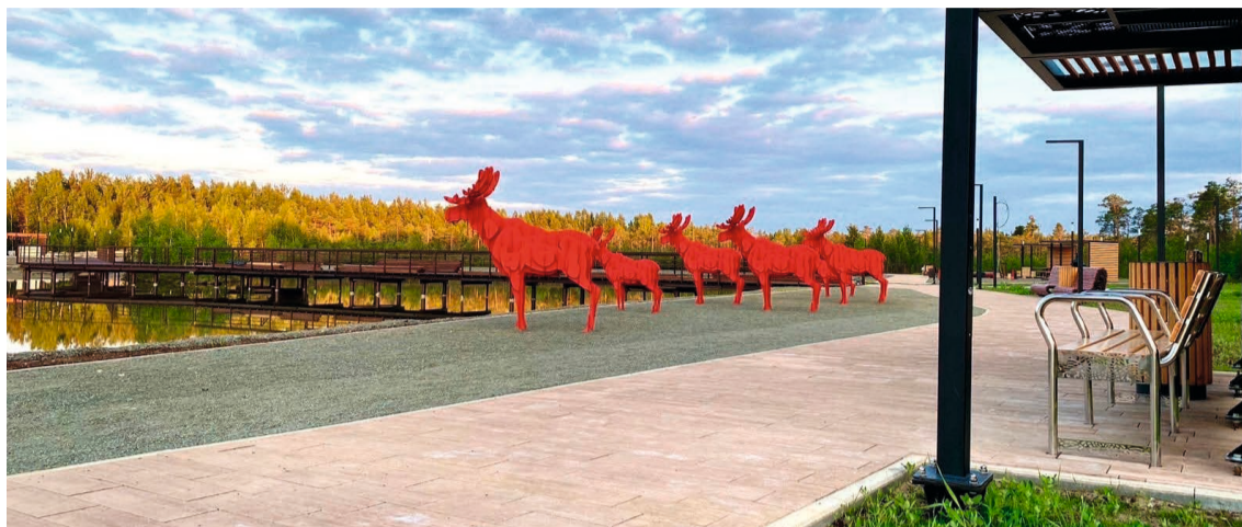
Знаковым событием для советчан стало открытие Озёрного парка «Картопля»