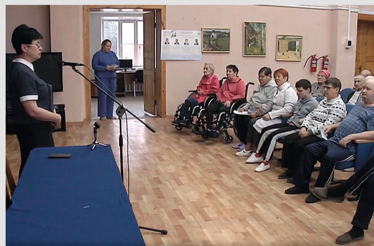
Подопечные Советского пансионата круглосуточного ухода узнали, как для них будет организован процесс выборов

Для знакомства с претендентами на должность губер-