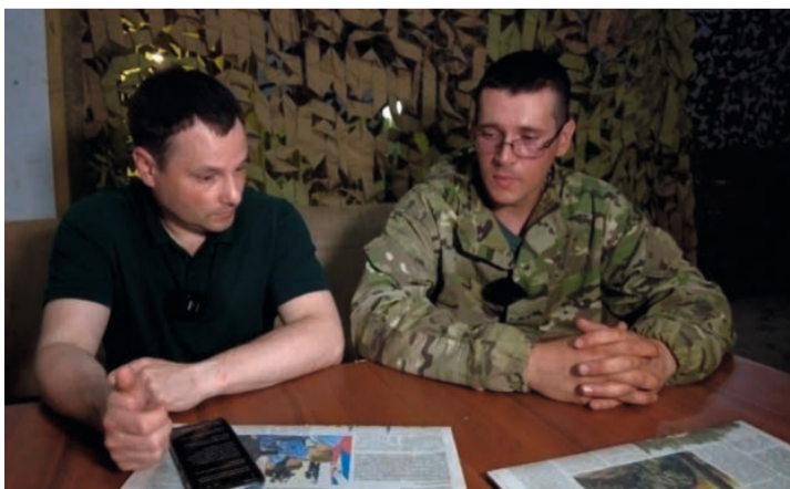
Про свой подвиг «Беркут» рассказывает нехотя

Больше материалов — в телеграм-канале «ЮграСолдату».