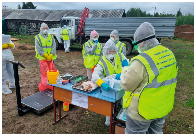
Специалисты произвели отбор биоматериалов погибшей птицы для отправки на дополнительные лабораторные исследования