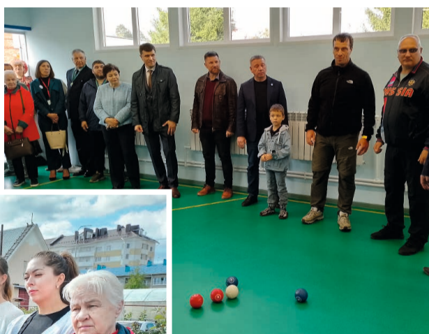
Для игры используются мячи разных цветов

«Я довольно тесно общаюсь с Геннадием Владимировичем и всегда отмечаю в нём одно ценное качество: он никогда