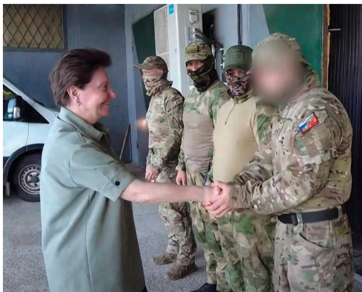
Главе региона важно поговорить с бойцами именно здесь. Лично убедиться, что у них всё хорошо

— Она идёт сама и ведёт за собой команду. Сейчас она узна-