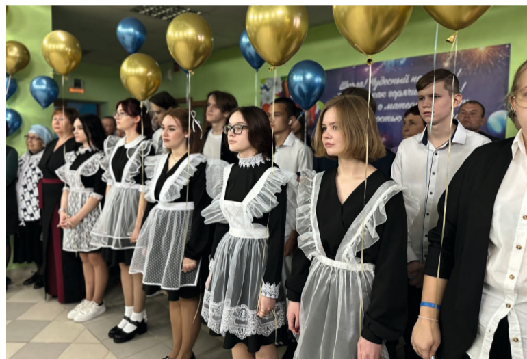
В центре внимания 1 Сентября — школьные выпускники, которым предстоит определиться с выбором профессии

Школе Малиновского, одной из старейших в Советском районе, в текущем году исполнилось 60 лет. 1 сентября её двери открылись для 310 учащихся, 24 ребёнка сели за парты впервые.