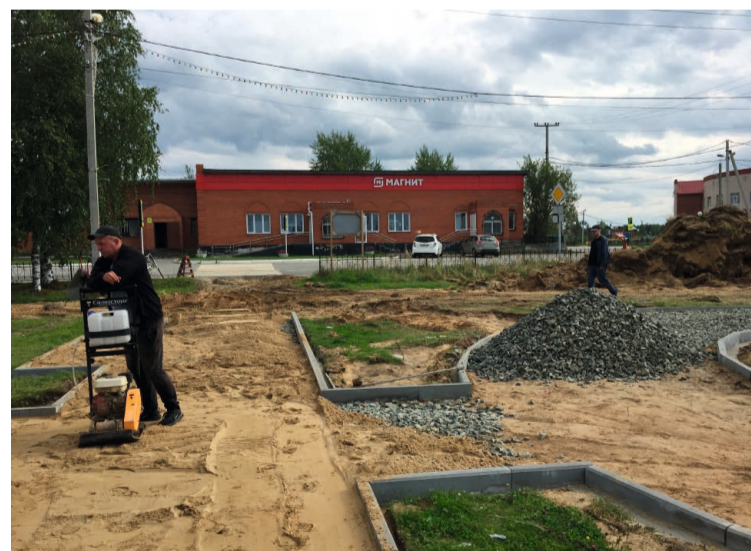
В г.п. Таёжный обустривают Таёжный парк, его сдача в эксплуатацию намечена на 2024 год

В Нягани готовят к открытию новый опорный пункт полиции. В нём будут работать два участковых уполномоченных и один инспектор по делам несовершеннолетних. В помещении создадут все условия для комфортного приёма граждан, в том числе для представителей маломобильных групп.