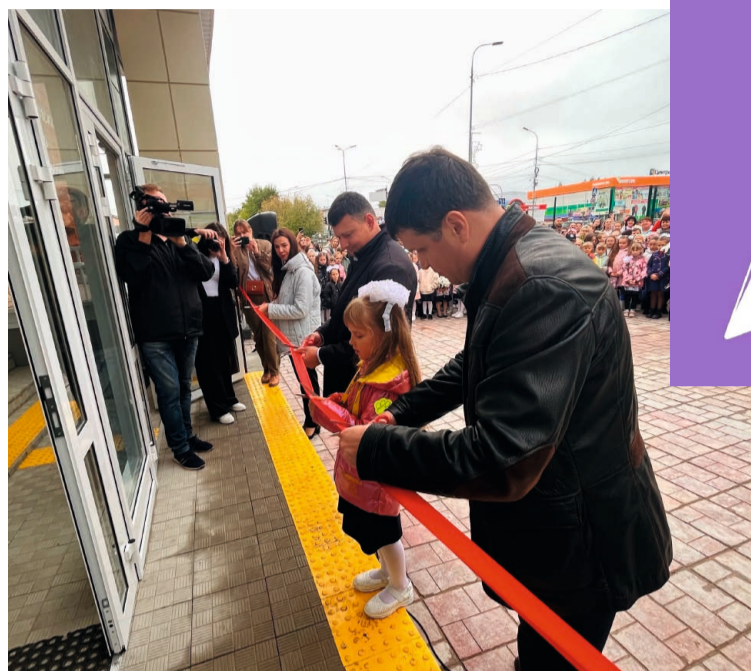
Торжественное открытие Детской школы искусств после капитального ремонта состоялось 1 сентября

А накануне радостного события качество проведённых работ оценили участники общественной приёмки. Сложно сказать, что в здании Школы искусств осталось необновлённым. Во время ремонта