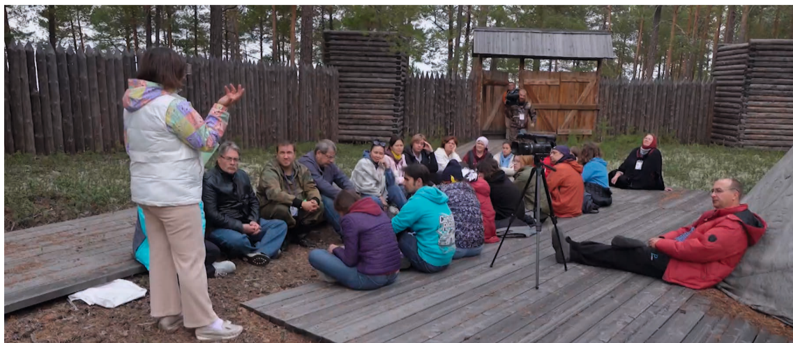
Творческая мастерская для начинающих поэтов и прозаиков

Мастер-класс по прозе для начинающих литераторов провёл гость из столицы Югры, член Союза писателей Рос-