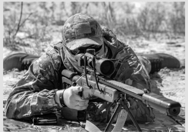
Снайпер работает с СВ-98

Есть такая профессия, где нужно уметь по несколько часов лежать на одном месте, никак себя не выдавая, забыв про все свои желания и потребности. Выжидать, выслеживать и в нужный момент выстрелить. Один раз, точно в цель, поразив противника. Именно таких специалистов, снайперов, набирает Росгвардия Югры для комплектования команд на специальную военную операцию.