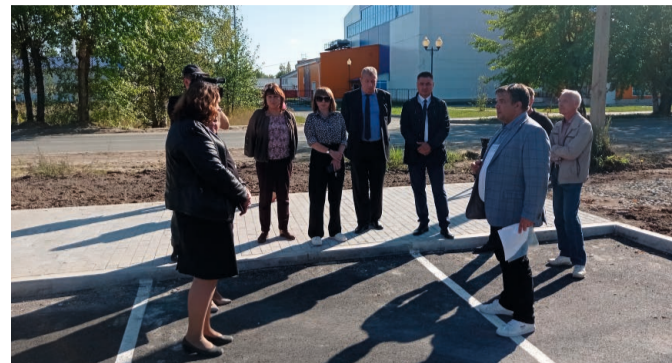
Площадь новой автостоянки составляет 1,8 тысячи кв. м, она рассчитана на 22 парковочных места

В Советском в рамках реализации регионального проекта «Формирование комфортной городской среды» завершён первый этап благоустройства общественной территории «Вознесенский парк». На карте районного центра появилась ещё одна автомобильная стоянка и участок пешеходной зоны.