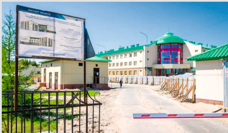
В Ханты-Мансийске до конца года построят новый корпус технолого-педагогического колледжа

В Нягани благоустраивают парковую зону в микрорайоне Западный. Работы ведут поэтапно и завершат в 2025 году. По проекту в парке будет культурно-досуговая зона, детская игровая и спортивная площадки, большая пешеходная зона с качелями, беседками и арт-объектами. Благоустройство общественных пространств — приоритетное направление для Команды Югры.