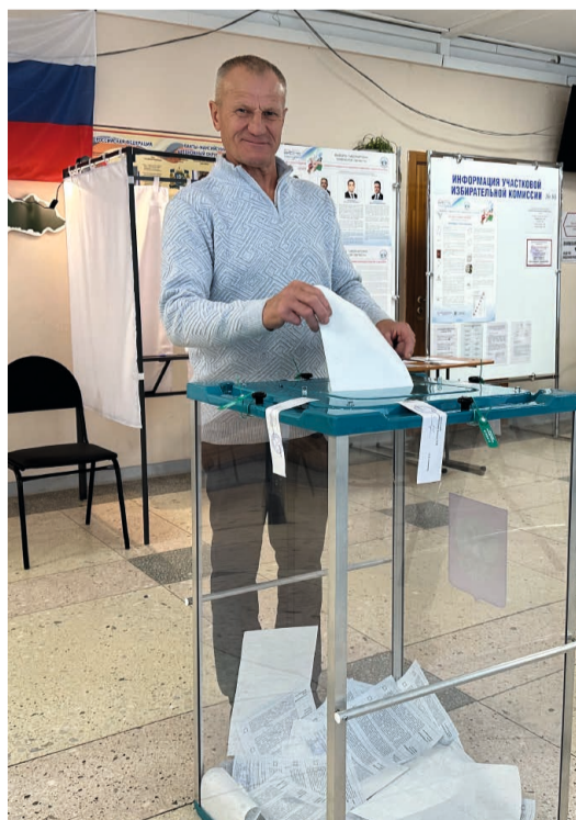
Явка избирателей по муниципальным выборам составила 46,8 %

Участки закрылись в 20:00, и члены участковых комиссий приступили к подсчёту голосов