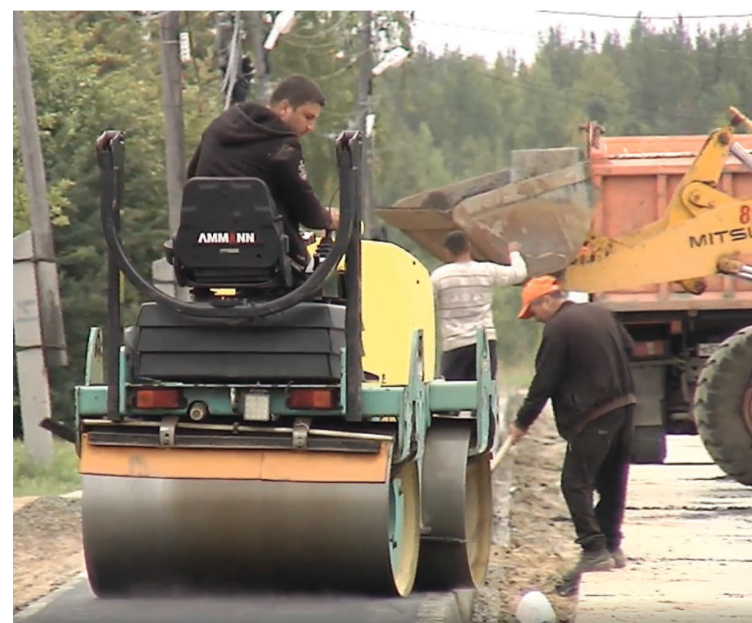
Новый тротуар обеспечит безопасность пешеходов

300 метров дорожного полотна выровняют и оденут в новенький асфальт. «Предстоит демонтировать десять дорожных плит и заложить щебнем углу-