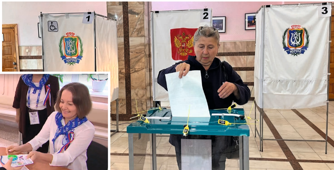
Многие жители приходили на избирательные участки с самого утра

На всех избирательных участках в течение дня дежурили общественные наблюдатели. Им необходимо было убедиться в том, что процесс проходит в строгом соответствии с нормами законодательства. «С одной стороны, моя функция, вроде бы, очень проста: я должна следить за тем, что происходит на избирательном участке, — поделилась своим мнением