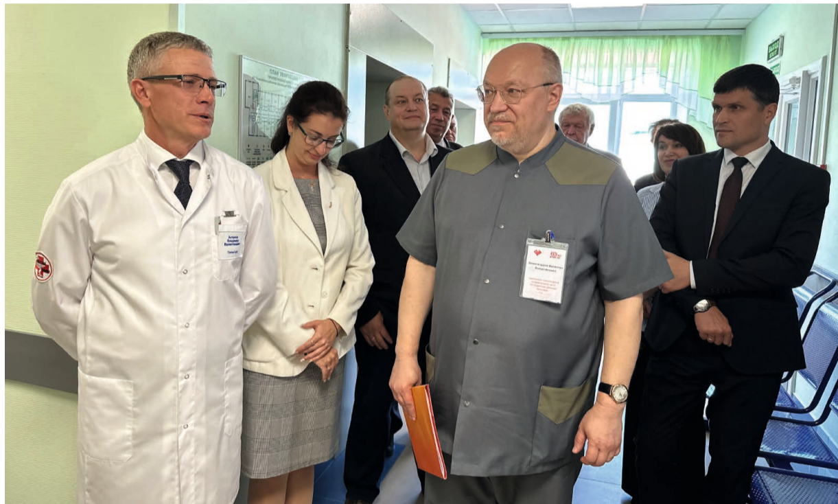
В общественной приёмке новых отделений приняли участие глава Советского района, депутаты, общественники и специалисты окружного Департамента здравоохранения

Теперь жители Советского района и Югорска, имеющие сердечно-сосудистые заболевания и проблемы урологического профиля, получают квалифицированную медицинскую помощь, не выезжая в крупные медцентры округа. В районной больнице открылись отделения кардиологии и урологии. А накануне прошла их приёмка, в которой приняли участие глава муниципалитета, депутаты, общественники и специалисты окружного Департамента здравоохранения.