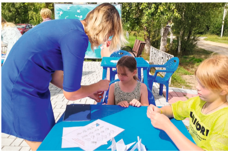
На мастер-классе всех желающих научили складывать журавликов из листов бумаги

мои родственники были там, потому что среди погибших — дети их знакомых. Такого не должно быть. Поэтому я, несмотря ни на что, вместе с внуками пришла, чтобы мастерить журавликов в память об этих детях».