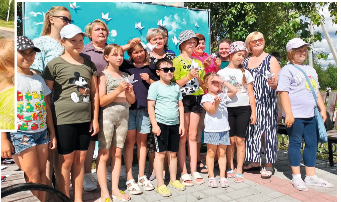
Акция памяти в г.п. Таёжный собрала не только детей, но и взрослых