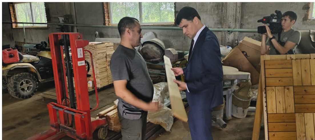
По словам руководителя нового деревообрабатывающего предприятия, на сегодняшний день аналогичных производств нет не только в Советском районе, но и в Югре