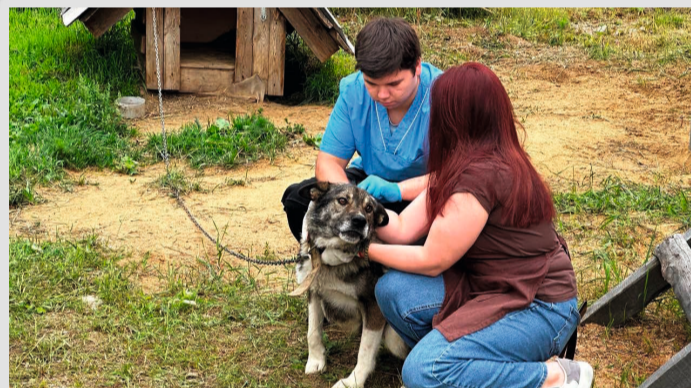
Вакцинация против бешенства обязательна: на соседних территориях выявлены очаги заболевания