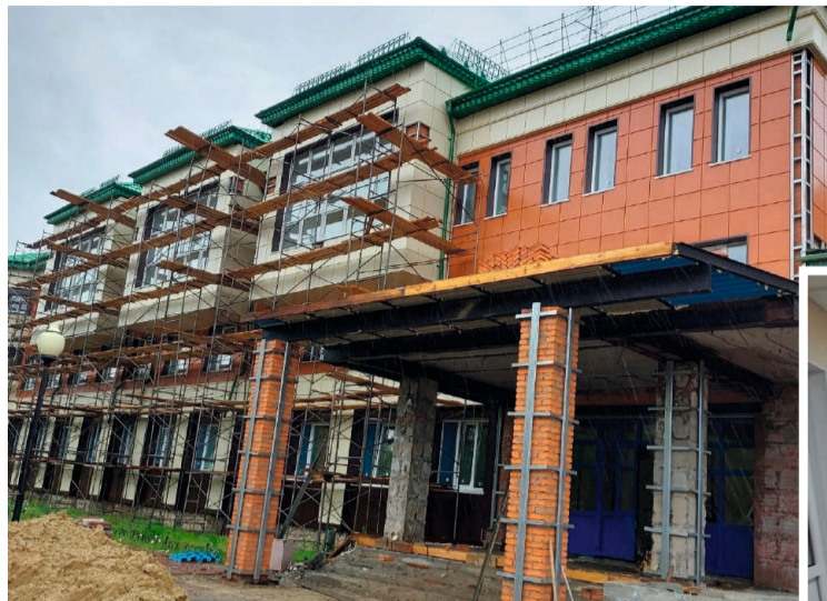
В настоящее время под пристальным вниманием партийцев — капремонт ДШИ в Советском

На объектах партийцы оценивают количество техники и рабочих — достаточно или нет, проверяют качество. Если видят отставание от графика, дают поручение подрядчику — ускориться, исправить недочёты. Подрядчик должен понимать, что не имеет права никого подвести, работает для людей.