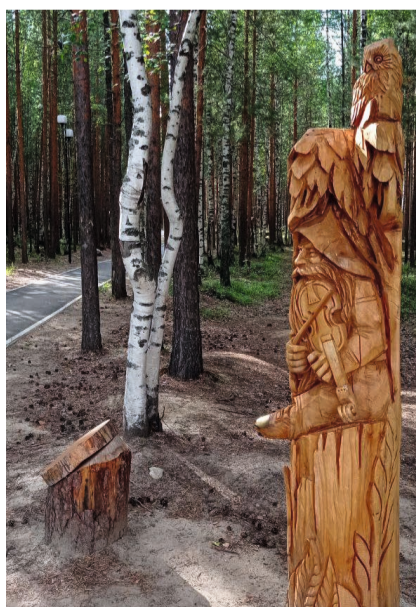
Маршруты «Леса легенд» появятся на аллеях парка

В департаменте социального развития администрации Советского района подвели итоги конкурса социально-ориентированных проектов среди районных некоммерческих организаций. В этом году на соискание субсидии в 200 тысяч рублей из местного бюджета с конкурсными работами заявили общественные объединения «Скрепка» и «Блики».