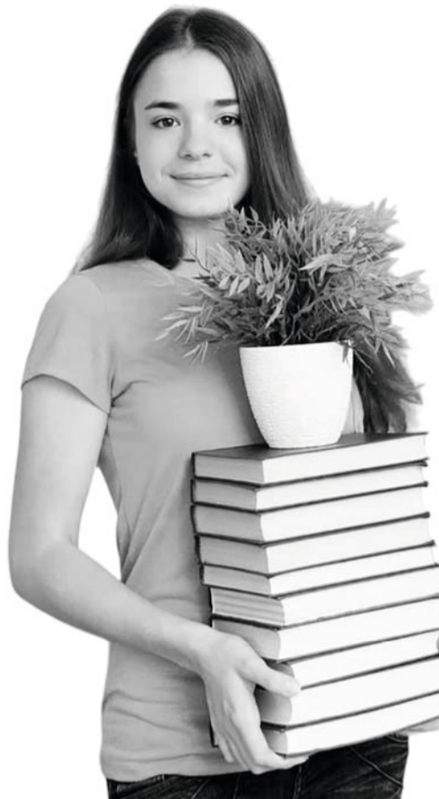
После поступления в институт сразу же встаёт вопрос о проживании