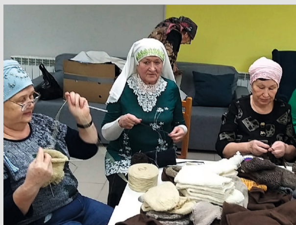
Участницы женского клуба «Ак-калфак» помогают нашим бойцам, находящимся в зоне СВО

Свой 55-й юбилейный год Советский район встречает не только как территория, уверенно нацеленная на социально-экономическое развитие, но и как большая многонациональная семья. Сегодня для самых активных её представителей создаются все условия для плодотворной общественной деятельности, в том числе в рамках национальных некоммерческих объединений.