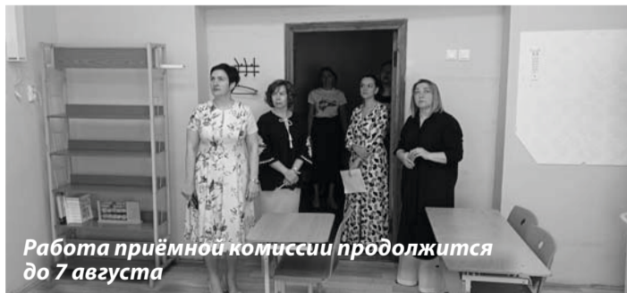
Работа приёмной комиссии продолжится до 7 августа

В конце прошлой недели в Советском районе стартовала приёмка муниципальных образовательных организаций. Готовность к новому учебному году проверяет комиссия, в которую вошли сотрудники районной администрации и Думы, полиции и Росгвардии, а также представители профсоюза педагогов и родительской общественности.