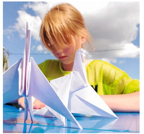
Многие участники акции успели смастерить по несколько бумажных птичек

мои родственники были там, потому что среди погибших — дети их знакомых. Такого не должно быть. Поэтому я, несмотря ни на что, вместе с внуками пришла, чтобы мастерить журавликов в память об этих детях».