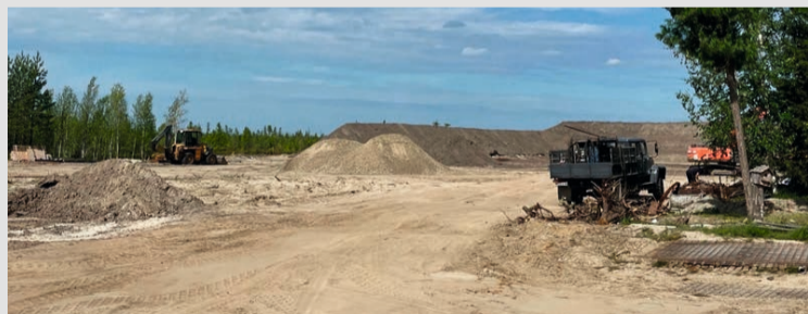
В Нижневартовске большой биатлонный центр построили уже наполовину

Команда Югры выполнила почти треть проектов народной программы карты развития. Но важнее цифр — результат, который видят жители на улицах городов, районов, посёлков. В округе ремонтируют дворы и дороги, строят школы и дома, благоустраивают парки, скверы. Большая работа направлена на единую цель — повышение качества жизни югорчан. В нашей подборке — итоги работы Команды Югры за неделю.