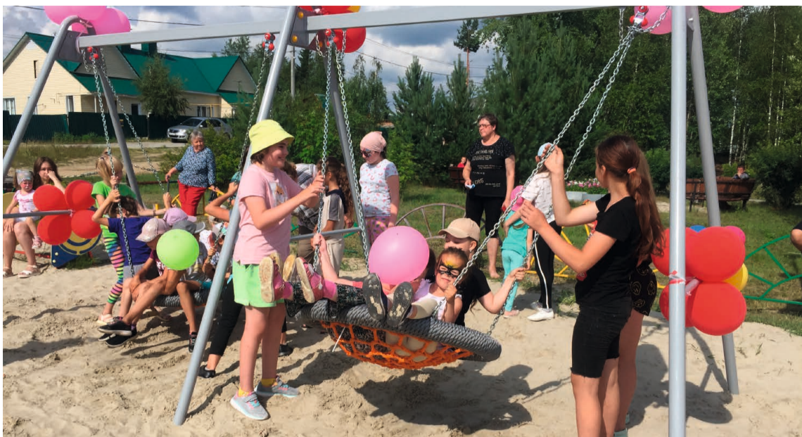
Качаться на таких качелях-«гнездах» — одно удовольствие!