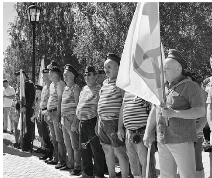
Военные моряки и офицеры Советского района вместе со всей страной отметили свой праздник

В последнее воскресенье июля отмечается одна из самых важных дат для каждого, кто причастен к службе в ВМФ и является частью огромного морского братства. Военные моряки и офицеры Советского района вместе со всей страной отметили свой праздник — День Военно-Морского Флота. Торжественный митинг состоялся у мемориала «Наказ матери».