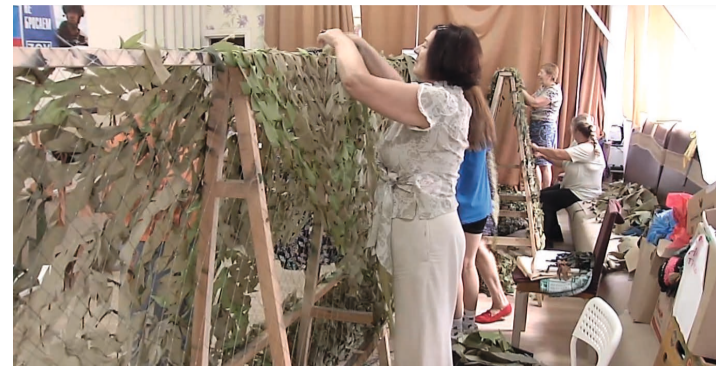
За десять месяцев в зону СВО отправлено порядка 140 маскировочных сетей

Всё для фронта, всё победы. На базе центра социальных и благотворительных проектов «Содействие» продолжает работу, столь необходимую для наших бойцов, находящихся на передовой специальной военной операции, женское объединение «Своих не бросаем Советский».