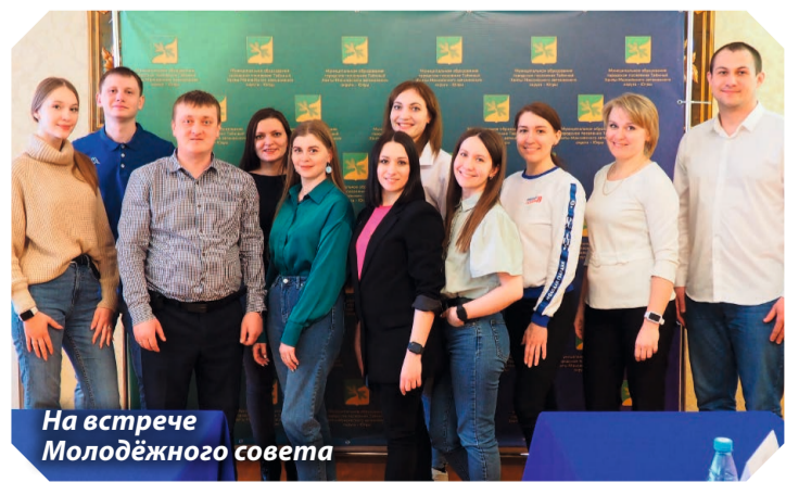
На встрече Молодёжного совета