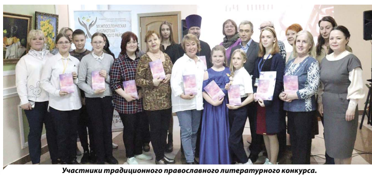
Участники традиционного православного литературного конкурса.

Каждый год 24 мая в России отмечается День славянской письменности и культуры. Этот праздник связан с именами святых равноапостольных братьев Кирилла и Мефодия — просветителей, создателей славянской азбуки, проповедников христианства, первых переводчиков богослужебных книг с греческого на славянский язык. Межпоселенческая библиотека Советского района на минувшей неделе провела творческий вечер, в ходе которого были подведены итоги традиционного муниципального православного литературного конкурса, который в этом году получил название «Когда звучит в тебе русское слово». Принимали в нём участие как профессиональные, так и начинающие авторы от 10 лет и старше в номинациях «Проза», «Поэзия», «Публицистика». По словам заведующей отделом социокультурных проектов «Межпоселенческой библиотеки Советского