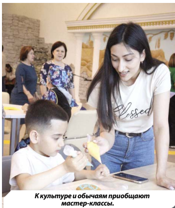
Культуре и обычаям приобщают мастер-классы.

Ежегодная акция «Библионочь» в 2022 году прошла по всей России уже в одиннадцатый раз. Библиотеки, книжные магазины, литературные музеи и культурные центры по всей стране представили специальную программу, куда включили творческие мастер-классы, экскурсии, лекции, встречи с писателями, поэтические чтения, книжные ярмарки. Акция прошла под девизом «ПроТрадиции». Она была посвящена Году народного искусства и нематериального культурного наследия народов России.