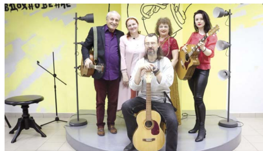
Местные барды на встрече «Звенящих струн многоголосье».

Многие дети пришли вместе с родителями, которые не только наблюдали, но и сами участвовали в мастер-классах. «У нас вообще дети творческие, дома постоянно что-нибудь делаем: и свечи, и мыло, и цветы. Знать традиции, помнить историю — я считаю,