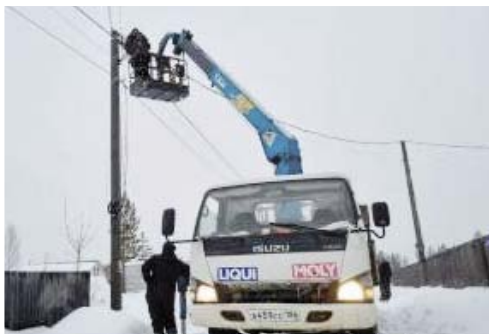
Стоимость сетей электроснабжения в СНТ «Дорожник» — восемь миллионов рублей.

Стоимость сетей газоснабжения — порядка 15 миллионов рублей, сетей электроснабжения — восемь миллионов рублей. Всё это члены товарищества построили, создали своими силами, и вот теперь сети могут быть в рамках процедуры банкротства проданы для погашения задолженности.