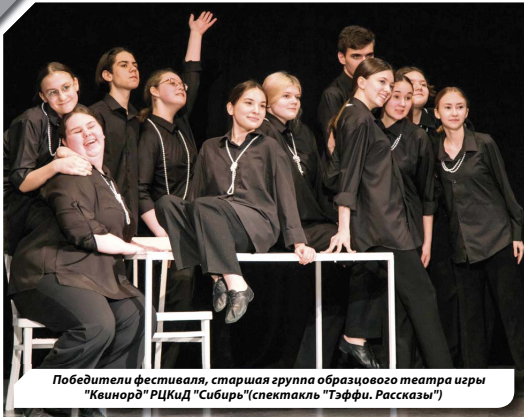
Победители фестиваля, старшая группа образцового театра изры «Квинорд» РЦКиД «Сибирь» (спектакль «Тэффи. Рассказы»)

На минувших выходных в Советском прошёл районный фестиваль «Линия театра-2022». На сцене ЦК «Сибирь» свои спектакли на суд жюри и зрителей представили коллективы из городов Урая, Нягани, Советского и Югорска. Какие постановки привезли в этом году и кого высоко оценили члены жюри — читайте в нашем материале.