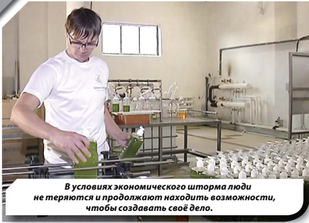
В условиях экономического шторма люди не теряют и продолжают находить возможности, чтобы создавать своё дело.