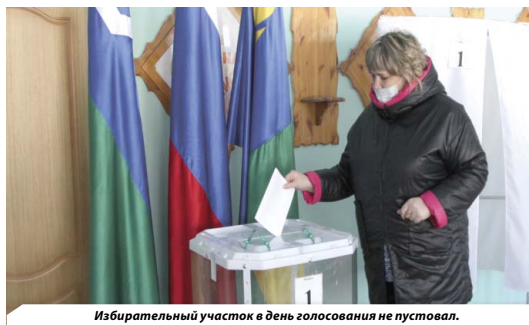
Избирательный участок в день голосования не пустовал.