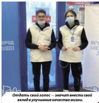
Отдать свой голос — значит внести свой вклад в улучшение качества жизни.

Осталось совсем немного времени до завершения голосования за общественные территории, которые будут благоустроены в рамках программы «Формирование комфортной городской среды» федерального проекта «Жильё и городская среда» в 2023 году. Оборудованные зоны для отдыха и занятий физической культурой являются одним из главных признаков комфортной городской среды. Сделать среду действительно удобной и благоприятной возможно только с учётом мнения самих жителей. Голосование продлится до 30 мая онлайн на единой платформе — 86.gorodsreda.ru .