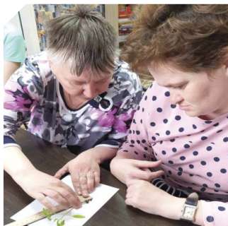
На сегодняшний день в проекте участвуют 28 человек с ограниченными возможностями.

— На сегодняшний день в проекте участвуют 28 человек с ограниченными возможностями, а также специалисты и волонтеры. Мы уже закупили необходимое оборудование и со-