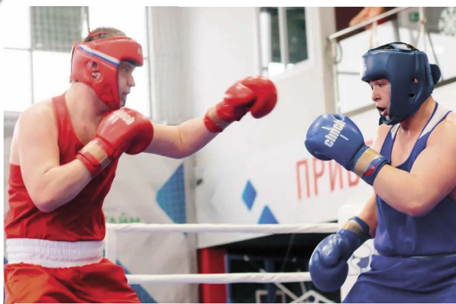
В составе сборной Югры в Первенстве приняли участие четыре спортсмена отделения бокса Советской СШОР.

✍ Марк Павлов.