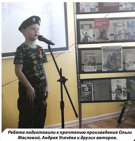
Ребята подготовили к прочтению произведения Ольги Масловой, Андрея Усачёва и других авторов.

В преддверии 77-й годовщины Великой Победы состоялась седьмой городской конкурс чтецов среди воспитанников дошкольных учреждений Советского. Финальный этап конкурса прошёл 24 апреля в Центральной детской библиотеке.