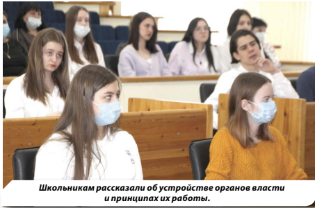
Школьникам рассказали об устройстве органов власти и принципах их работы.