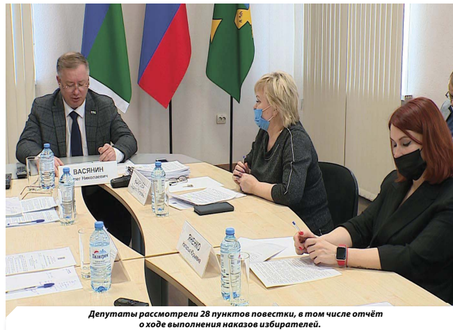
Депутаты рассмотрели 28 пунктов повестки, в том числе отчёт о ходе выполнения наказов избирателей.