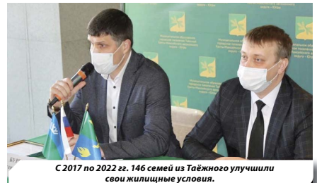
С 2017 по 2022 гг. 146 семей из Таёжного улучшили свои жилищные условия.

— Бизнесмены говорят, что продукт должен быть узнаваемым среди прочих аналогичных товаров, это поможет ему стать более конкурентоспособным. Помимо этого, у людей должны сформироваться определённые ассоциации с именем производителя продукта, с его товарными характеристиками и качествами — покупатели должны знать,