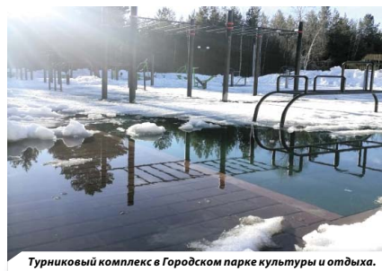
Турниковый комплекс в Городском парке культуры и отдыха.

Сегодня спортивная инфраструктура — одна из наиболее востребованных опций. Количество занимающихся физ-