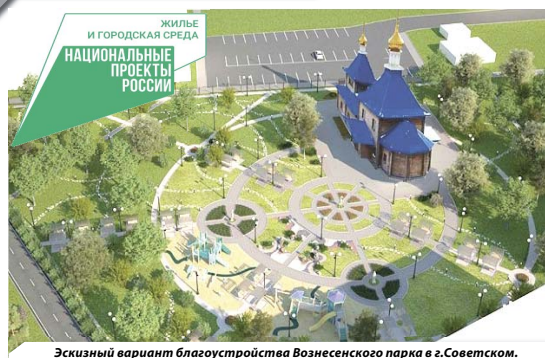
Эскизный вариант благоустройства Вознесенского парка в г. Советском.

Антон Грамшин. Иллюстрации из архива ОАО «ПТР».