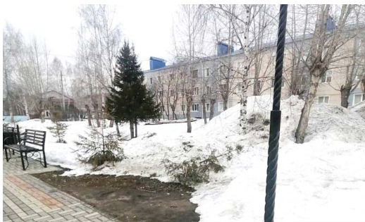
Во время расчистки аллеи «Ворота в город» снегоуборочная техника срезала деревья, высаженные вдоль дорожки.

Сломанные декоративные элементы обновят уже в ближайшее время, а вот как быть